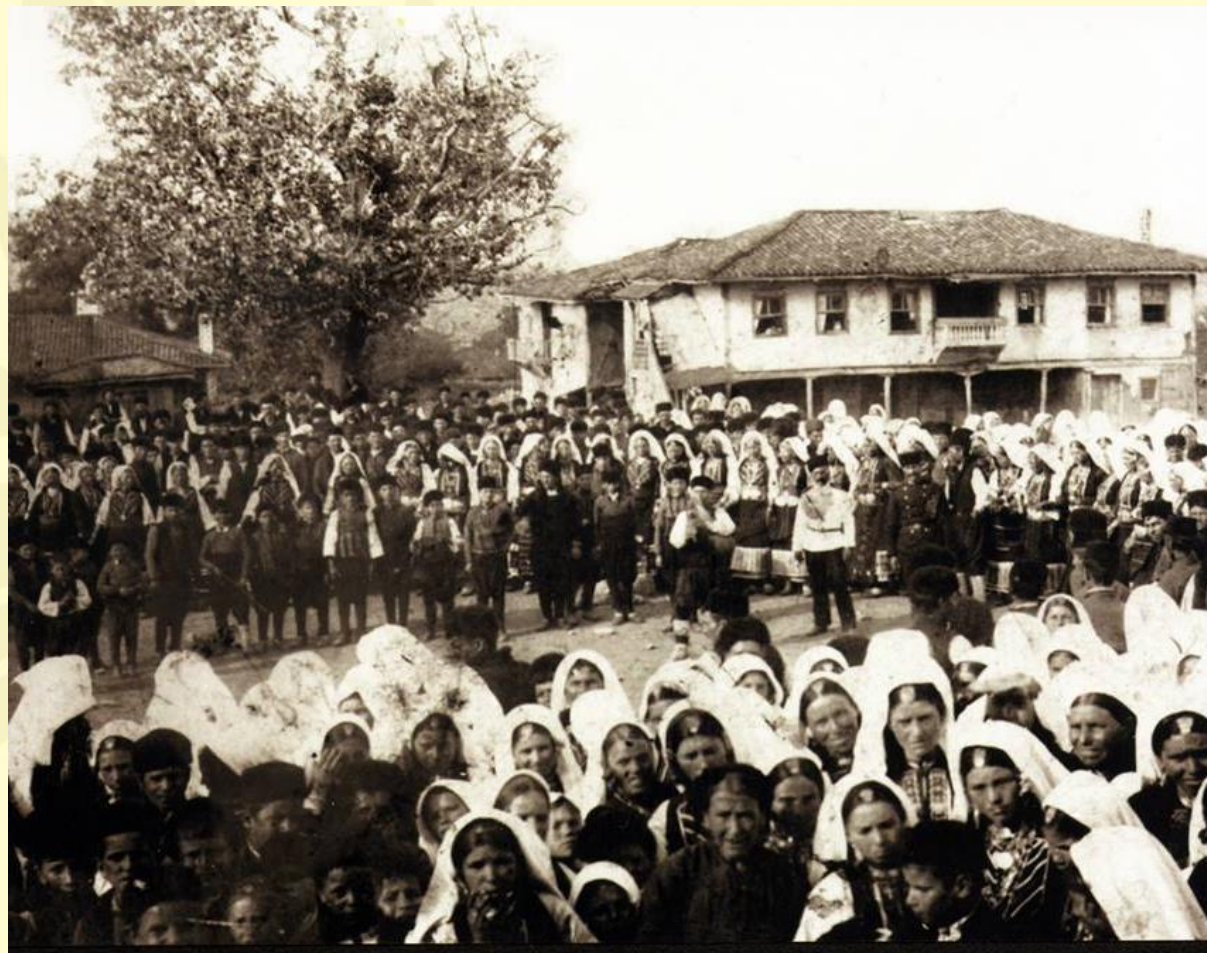
Снимка на Кавакли, 1887 г.

През XVIII и началото на XIX век, Кавакли, днешен Тополовград, е бил голямо и важно за района селище, с население близо 8000 жители. Имал е развито земеделие, животновъдство и занаяти. Бил е културен и религиозен център.