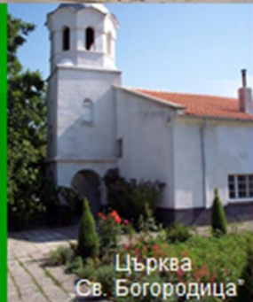
Църква Св. Богородица