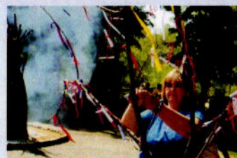
Geleneksel Kakavave Hidrellez etkinliği Yambol'da