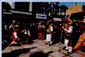
Yambol'un Kuker Topluluğu Edirne'de