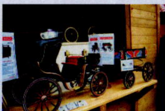
Традиционни одрински занаяти в Ямбол