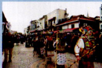
Ямболски кукери в Одрин

Projeye, Interreg-IPA Bulgaristan-Türkiye 2014-2020 SÖİ Programı aracılığıyla Avrupa Birliği tarafından eş- finansman sağlanmaktadır