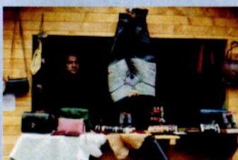
Edirne nin Geleneksel El Sanatları Yambol'da