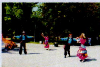
Обичаят „Какава-Хъдърлез“ в Ямбол