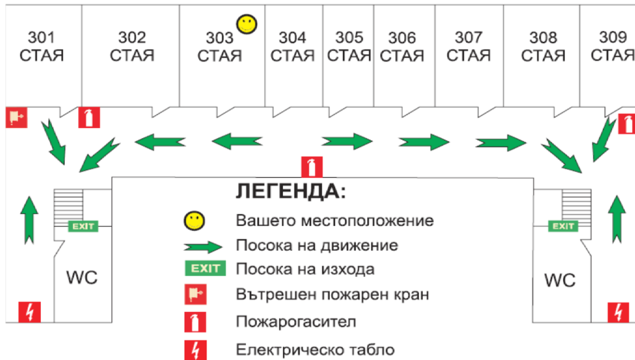
СХЕМА ЗА ЕВАКУАЦИЯ